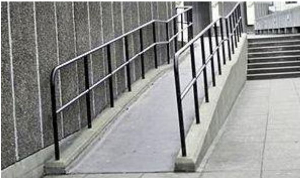
Gambar 3. Ramp