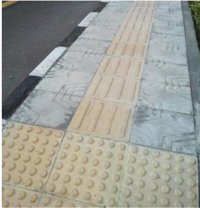
Gambar 2. Guiding Block