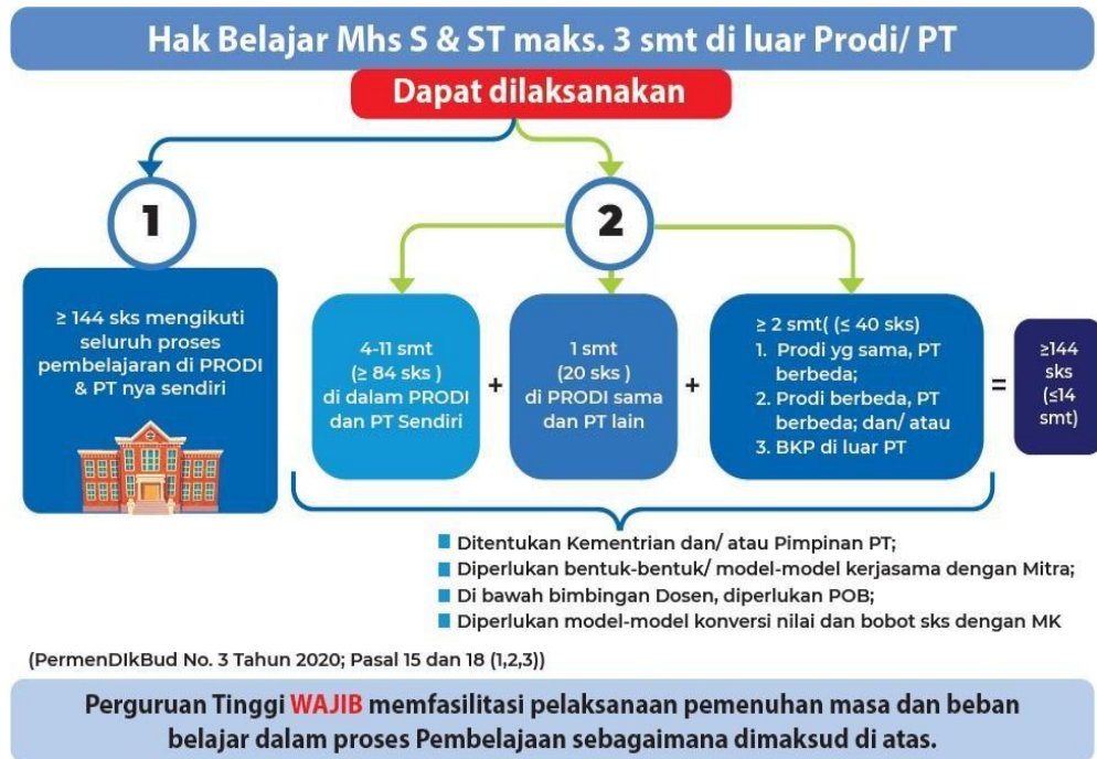
Gambar 1 Hak Belajar Mahasiswa Program Sarjana dalam Implementasi MBKM