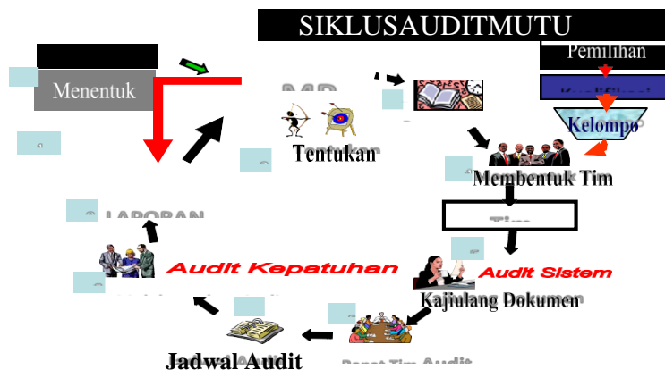
Gambar 2. Siklus AMI dengan 10 tahapan