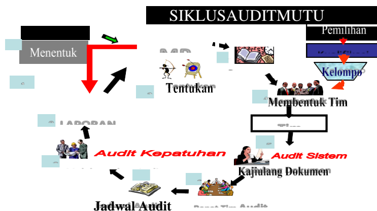
Gambar 2. Siklus AMI dengan 10 tahapan